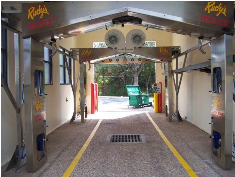
** Фото аналога из США